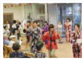
▲8月24日に開催された夏祭り