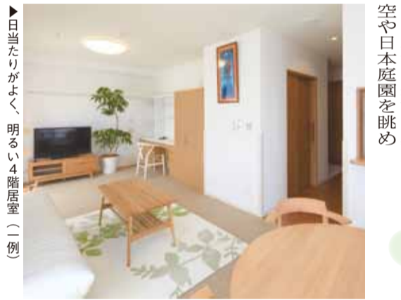
日当たりがよく、明るい4階居室（一例）