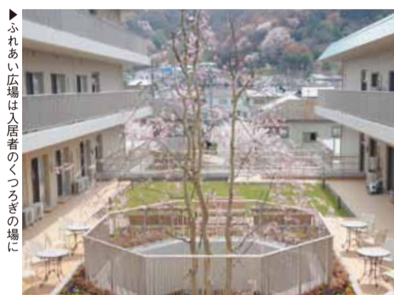
ふれあひ広場は入居者のくつろぎの場に